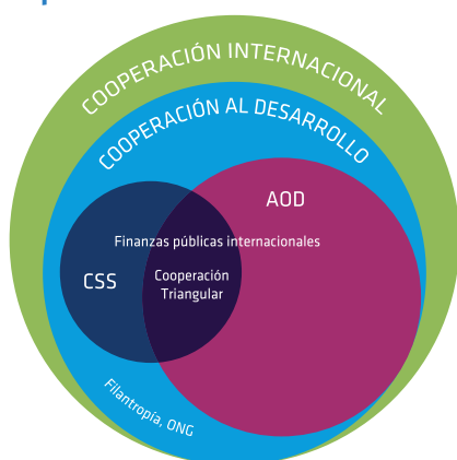
Diagrama 1 – La cooperación internacional en sus distintas acepciones

El diagrama que se presenta a continuación esquematiza las diversas acepciones de la cooperación internacional.